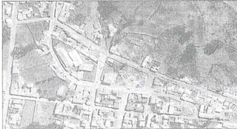
Fig. 3: Ubicación del Hospital Victor Ramos Guardia en la Ciudad de Huaraz.

El mejoramiento de la infraestructura a través la construcción del centro de salud, en un terreno que cumple con todas las características exigidas por la norma; con todos los ambientes, áreas de atención con espacios de circulación y tratamiento externo de acuerdo a la normativa sectorial correspondiente al nivel de centros de salud, establecimiento (I-4) presentando un diseño propio que contará con los siguientes servicios: