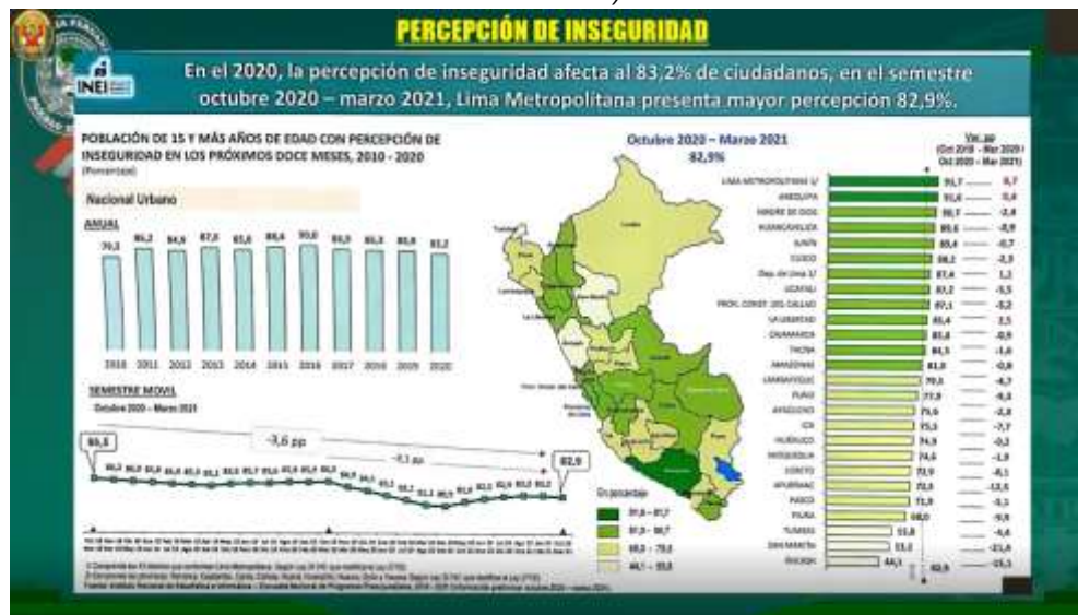
Gráfico N° 06: Percepción de inseguridad ciudadana en el Perú (Semestre octubre 2020- marzo 2021)