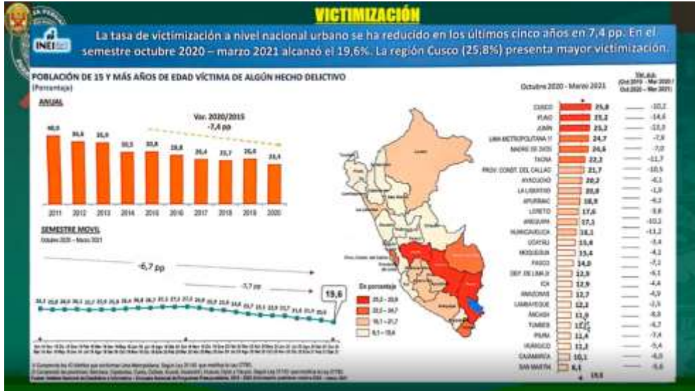
Gráfico N° 05: Victimización en el Perú (Semestre octubre 2020- marzo 2021)