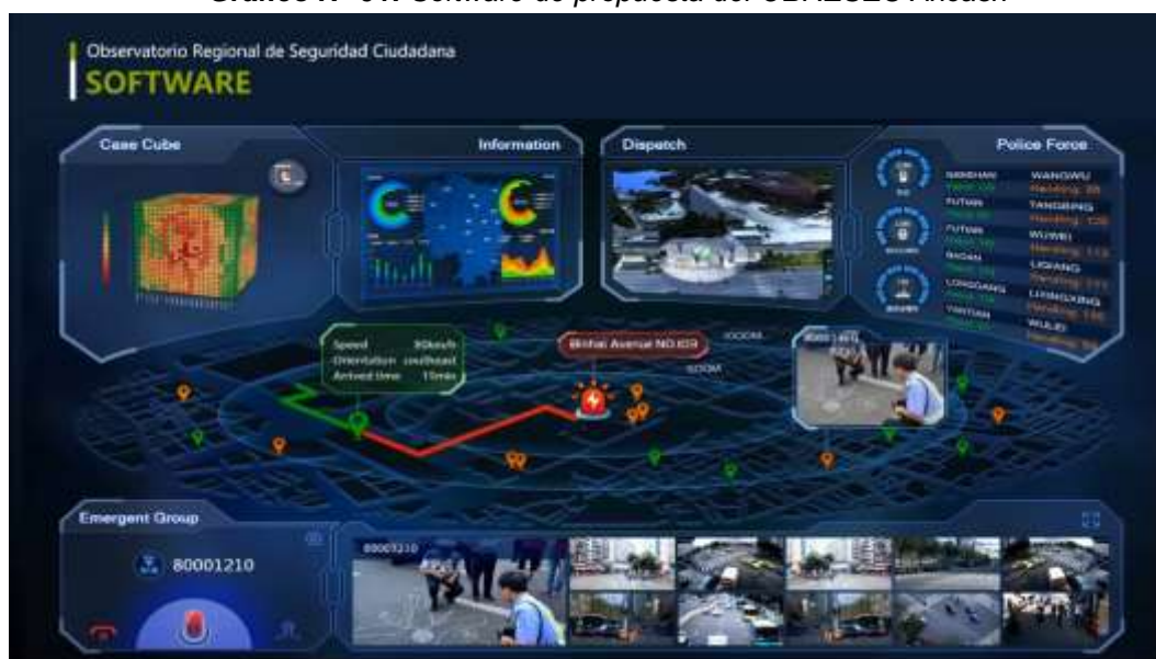
Gráfico N° 01: Software de propuesta del OBRESEC Ancash