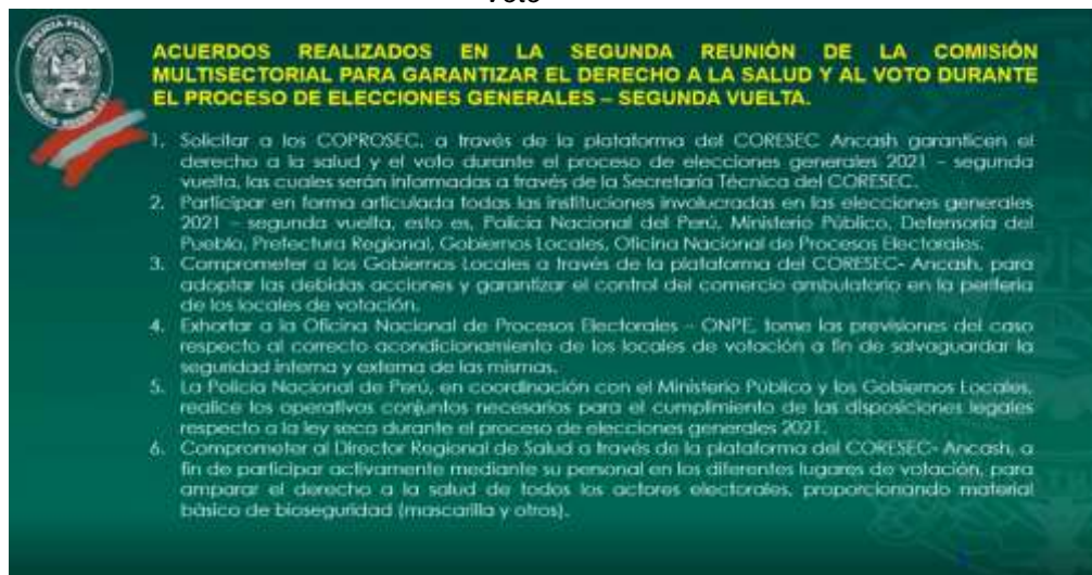
Gráfico N° 04: Acuerdos de la Comisión Multisectorial para garantizar el Derecho a la Salud y Voto