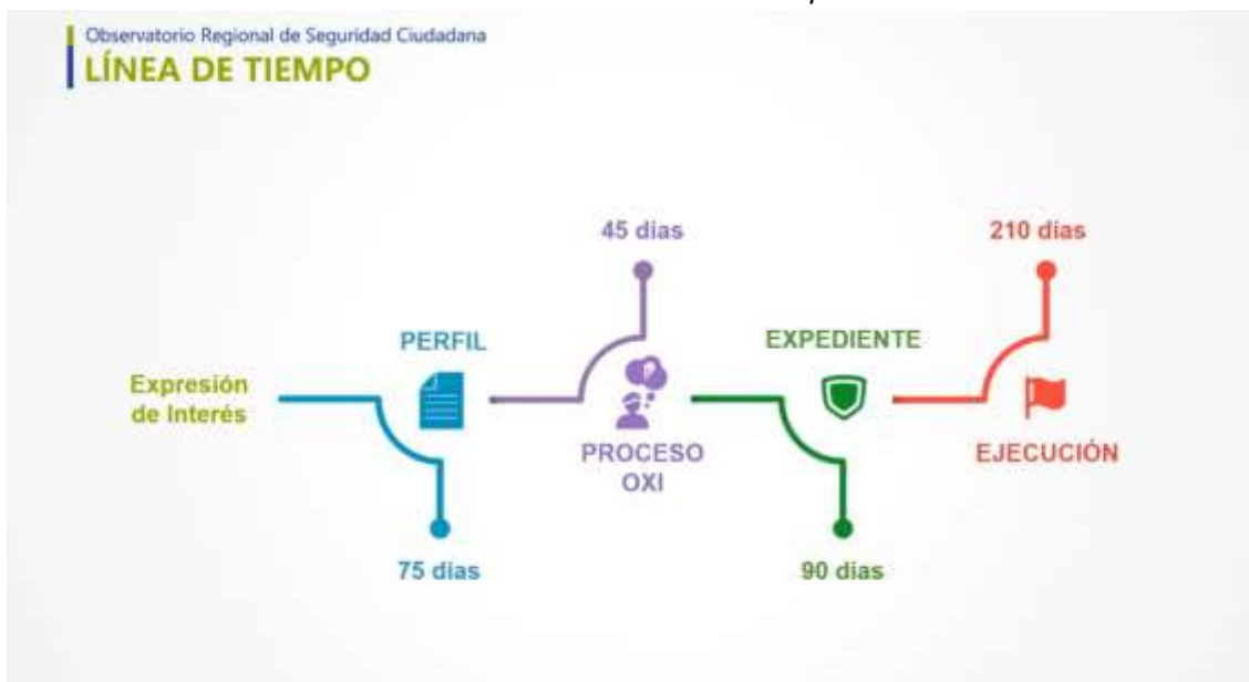
Gráfico N° 02: Línea de tiempo